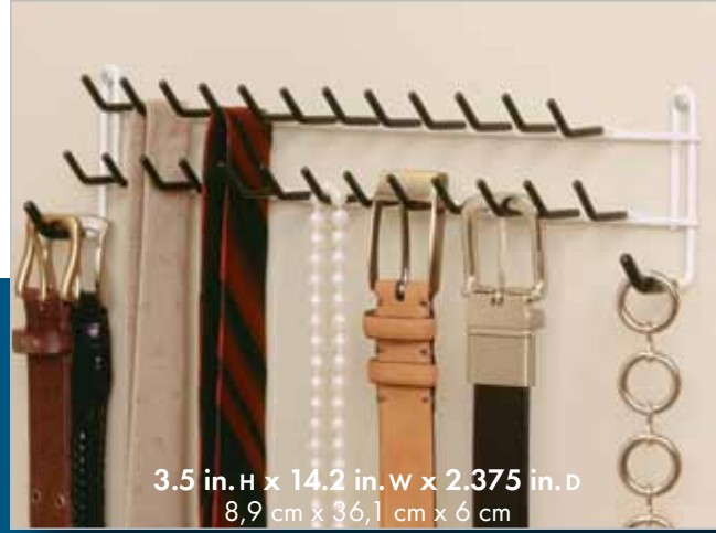
3.5 in. H x 14.2 in. W x 2.375 in. D 8,9 cm x 36,1 cm x 6 cm