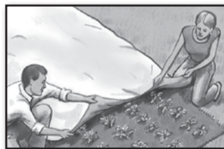
Vegetable Gardens Huertas