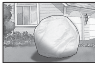
Landscape Protection Protección del paisajismo