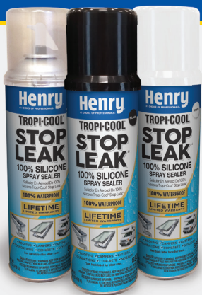
Available in clear, black and white

Henry® Tropi-Cool® Stop Leak® 100% Silicone Spray Sealer is a 100% silicone aerosol repair solution, formulated to provide a permanent leak-proof seal on a variety of surfaces.