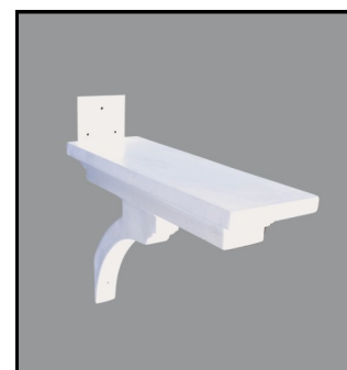
Support de la boîte à lettres

Étape 7: Selon la taille de la boîte à lettres (elle n'est pas incluse) qu'elle soit de taille standard ou grand format, la plateforme de support de la boîte à lettres doit être positionnée à une hauteur de 38" à 43" à partir du sol. Centrez le support de la boîte à lettres sur le poteau de pierre agglomérée et percez dans les trous déjà existants sur le support de la boîte à lettres, dans la colonne de pierre agglomérée et dans le poteau de bois en utilisant une mèche de maçonnerie 9/64. Faites tenir avec 3 visse n° 10.