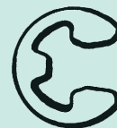
2 "E" Rings 2 Aros en "E" 2 anneaux de retenue "E"