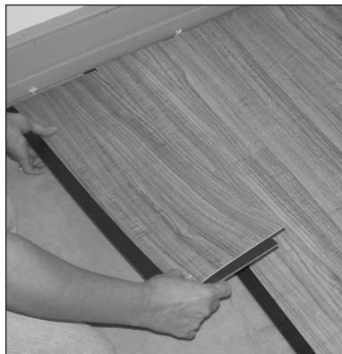
Figure / Figura 5

Comienza la segunda fila con la tabla cortada cerca de 2/3 del largo (60,96 cm). Mide y marca la tabla, luego con una regla y un cuchillo multiuso, simplemente marca la tabla y corta de un golpe.