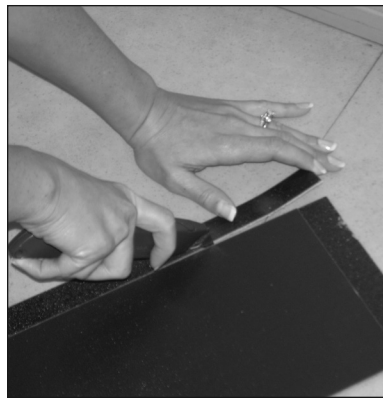
Figure / Figura 2