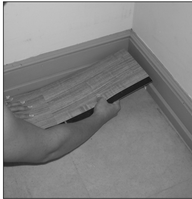
Figure / Figura 4

After installation is completed, we recommend rolling the seams with a floor roller in both directions to ensure bonding of both adhesive edges. You can rent a floor roller from your local Home Depot tool rental center.