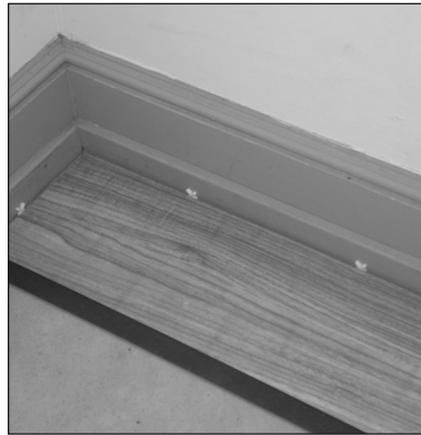
Figure / Figura 1

When installing the plank, it is strongly recommended to stagger the rows so that the short edge (6") seams are not in a straight uniform line and have a stagger of a minimum of 6" from row to row. We recommend the staggered random method ( Figure 3 ). However you may want to try other "patterns" of planks to suit your taste. allure can be installed with endless possibilities — your only limitation is your own imagination!