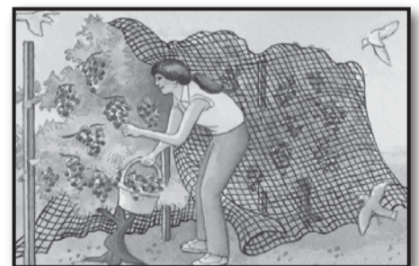
Grapes & Berries Uvas y bayas