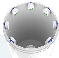
ROUND BRINE TANK TANQUE DE SALMUERA REDONDO