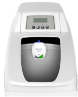
CABINET SOFTENER ABLANDADOR TIPO GABINETE