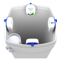
SQUARE BRINE TANK TANQUE DE SALMUERA CUADRADO

Avoid mounting the sensor within 2" of corners or brine well.