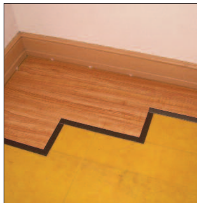
Figure / Figura 3

La instalación debe empezar por una esquina y continuar desde la pared con el borde inferior mirando en la dirección opuesta a la pared ( Figura 1 ). Deja un espacio de 6 mm (1/4 pu) como mínimo para que el contrapiso se mueva, dicho espacio quedará oculto al colocar las molduras. Corta el borde superior frente a la pared (toda la longitud de la primera fila, así como el exceso de borde en el lado corto de la primera tabla) ( Figura 2 ).