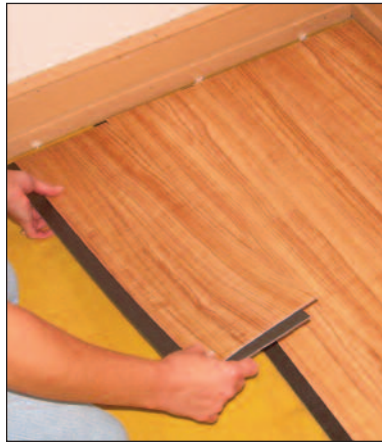
Figure / Figura 5

Start the third row with the plank cut at 1/3 of a length (1 foot). Again, the leftover piece can be used at the opposite end of the row, if the layout of the room permits. Continue this pattern for the remainder of the rows to be installed. Always place the cut end of the first plank against the wall ( Figure 5 ).