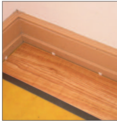
Figure / Figura 1

When installing the plank, stagger the rows so that the short edge (6") seams are not in a straight uniform line and have a stagger of a minimum of 6" from row to row. We recommend the staggered random method ( Figure 3 ).