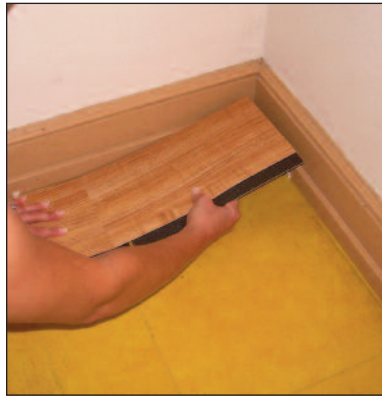
Figure / Figura 4

The over-edge butts up to the first row. Again, get one corner of the plank started tightly against the other, and on a 45 degree angle, roll the plank tightly into place. The remaining 1/3 piece can be used on the far wall, if the layout of the room permits ( Figure 4 ).