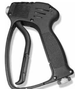
Figura 1 - 1MDC7

Para Obtener Partes de Reparación, en México Llame al 001-800-527-2331 24 horas al día - 365 días al año en EE. UU. Llame al 1-800-323-0620