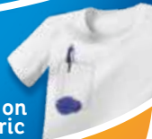
ink on fabric